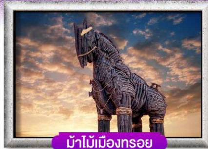
ม้าไม้เมืองทรอย