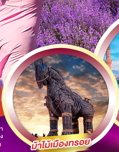
ม้าไม้เมืองทรอย

📅 เดินทาง 26 ก.ค.-03 ส.ค. | 09-17 ส.ค. 67