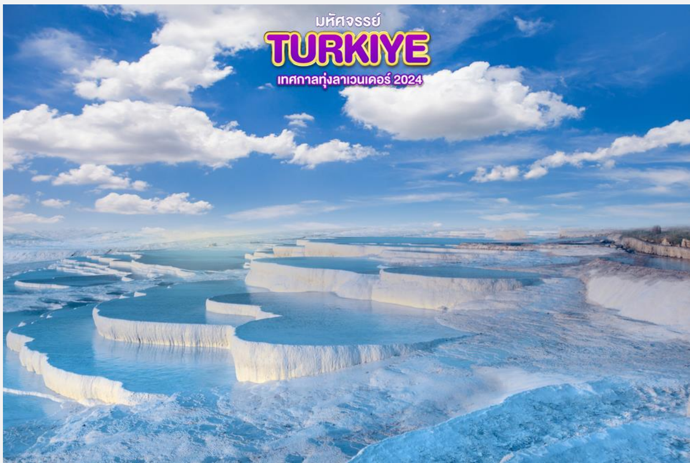
มหัศจรรย์ TURKIYE เทศกาลทุ่งลาเวนเดอร์ 2024

จากนั้น นำชม ปามุคคาเล่ แปลว่า ปราสาทปุยฝ้าย (Cotton Castle) มีลักษณะเป็นระเบียงน้ำพุเกลือร้อน ซึ่งเกิดขึ้นจากการเกิดแผ่นดินไหวของโลก เป็นเหมือนสถานที่ศักดิ์สิทธิ์ ซึ่งมีสรรพคุณในการรักษา บำบัดการอาการต่าง ๆ