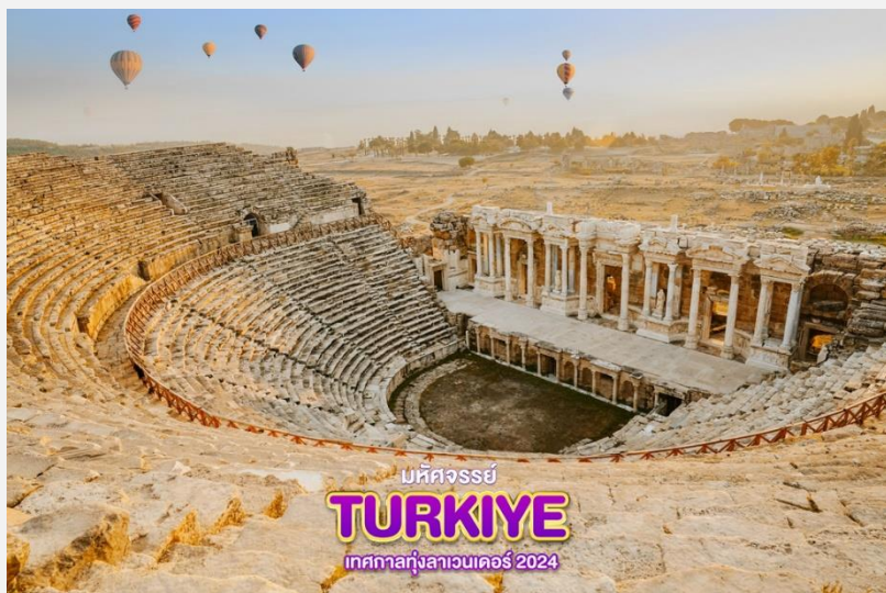
มหัศจรรย์ TURKIYE เทศกาลทุ่งลาเวนเดอร์ 2024

จากนั้น นำท่านชม เฮียราโพลิส (Hierapolis) ซึ่งมีความหมายว่า เมืองแห่งความศักดิ์สิทธิ์ สร้างขึ้นก่อนคริสตกาล มีอายุประมาณ 2,200 ปี จุดเด่นสำคัญของที่แห่งนี้คือ มีโรงละครขนาดใหญ่ ที่สามารถจุคนได้ถึง 12,000 คน อดีตงานเทศกาลหรือการแข่งขันต่างๆก็จะจัดที่โรงละครแห่งนี้ และรอบๆจะประกอบไปด้วย โรงอาบน้ำโบราณ สระน้ำโบราณ ประตูก่อเมือง ฯลฯ